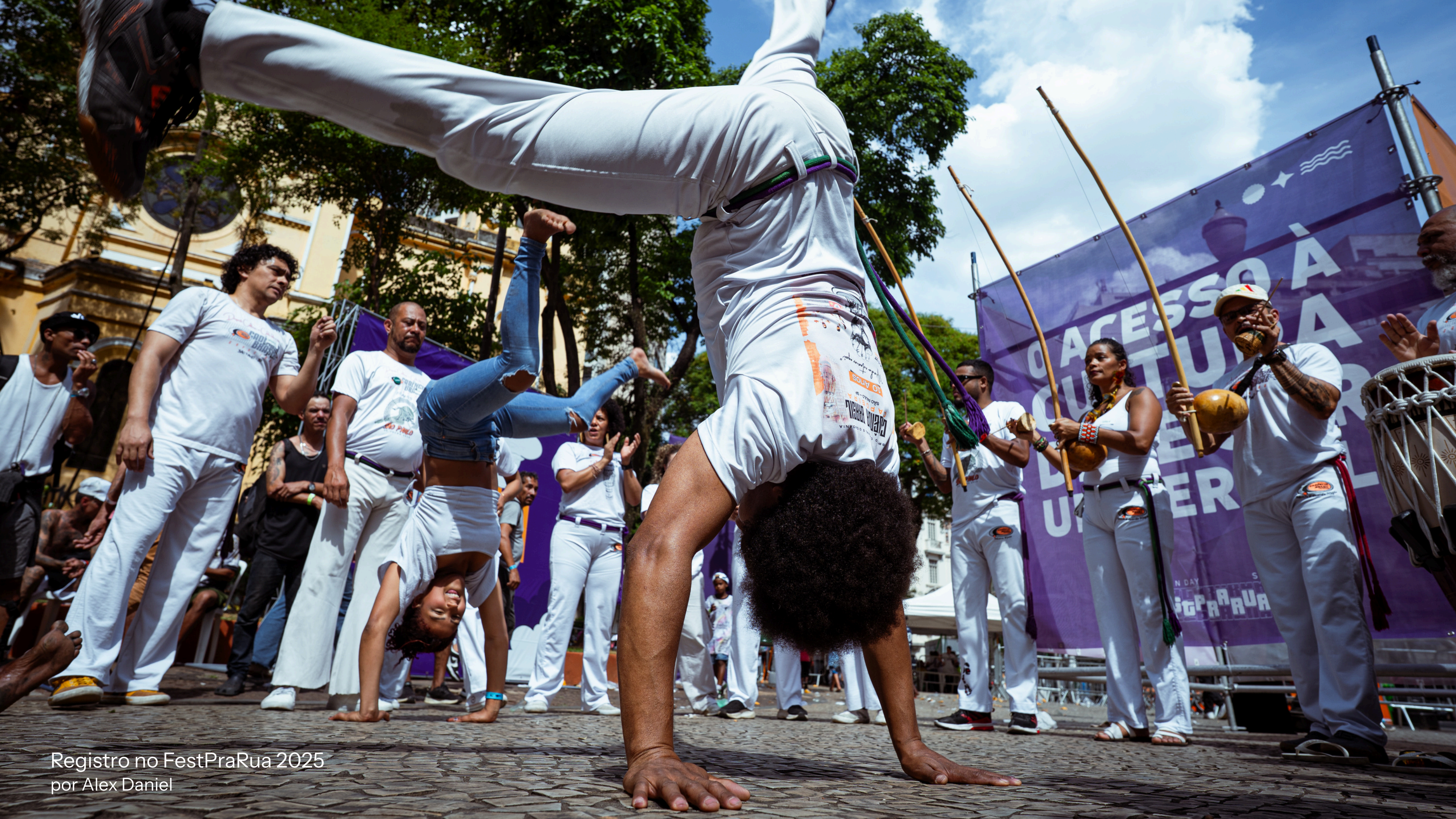
Registro no FestPraRua 2025